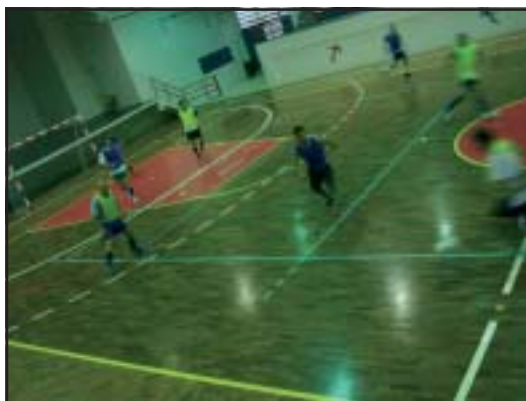
Quadra do São Luís, que reúne toda quarta-feira associados num disputado amistoso das 20 às 22 horas, vai ser palco do torneio. A equipe da Asbac defende o título de 2006.

O torneio contará com seis equipes compostas por servidores, dependentes de associados e funcionários terceirizados. Para inscrições e esclarecimentos contatar Vantoir, no telefone 3491-6366.