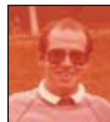
Casemiro hoje, e nos tempos de dirigente: boas lembranças