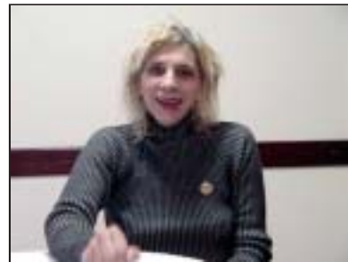
Stoklos: peça inovadora, baseada na narrativa

A grande atriz e mímica brasileira Denise Stoklos é a primeira atração em 2007 de uma série que vai levar os associados ao melhor dos eventos culturais em cartaz em São Paulo. Seu show no próximo dia 29 de março vai levar 100 asbaqueanos ao Teatro João Caetano. O espetáculo "Olhos recém-nascidos" estreou em 1º de fevereiro, e é um texto reflexivo sobre morte e vida, fins e recomeços, baseado principalmente na narrativa. Aborda também do envolvimento de cada um com sua profissão. Relata a atriz: "Usei-me para isso. Espero que valha a pena. Estou me arriscando no desconhecido".